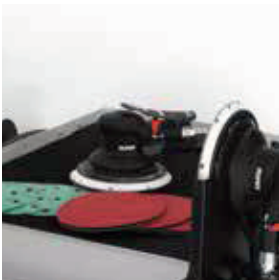
Table de travail en caoutchouc avec grand conteneur polyvalent